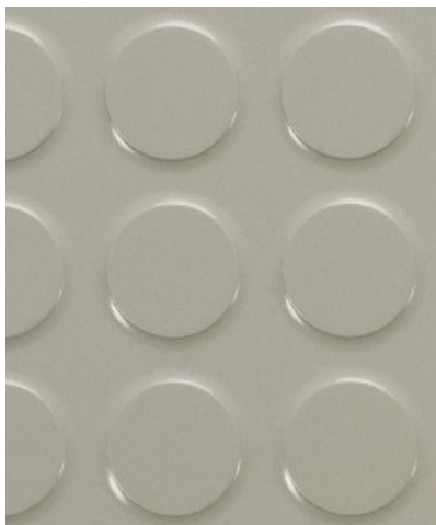
0003 Medium Grey